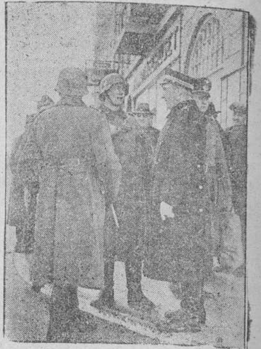
Claramente la da a entender esta foto lograda al azar en una de las calles de Copenhague. Por ello es cada vez mayor la unión de intereses entre Alemania y Dinamarca.

El magnífico, señor de higiene y deporte de la caza con galgos está de enhorabuena.—G.