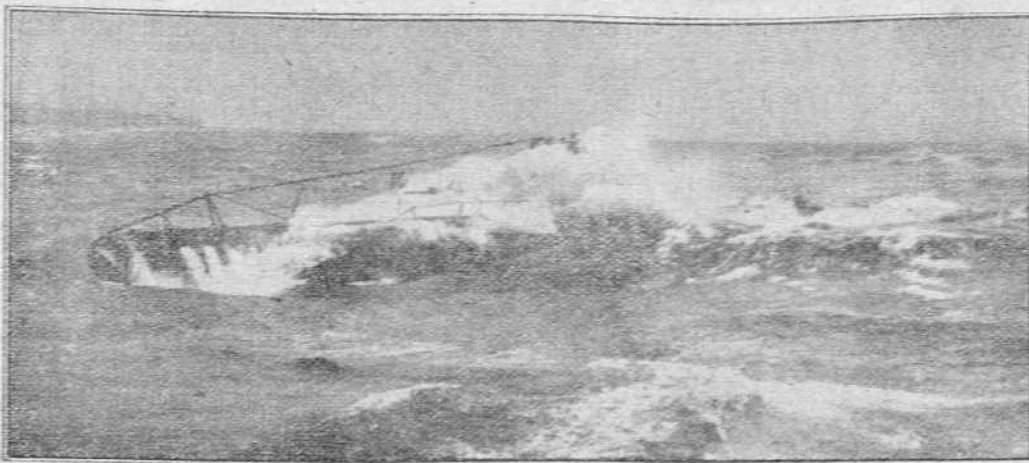
Un submarino alemán se encamina hacia el objetivo enemigo a través del mar embrevado