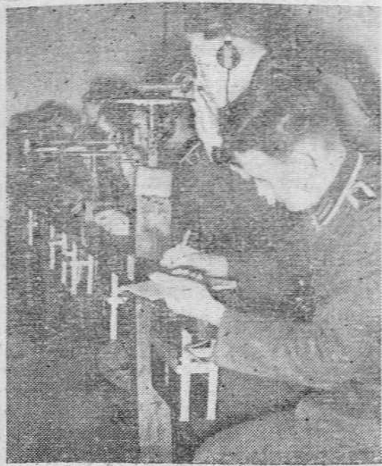
La preparación técnica de los artilleros alemanes es muy detallada. He aquí un grupo haciendo ejercicios con instrumentos para medir la intensidad de la luz