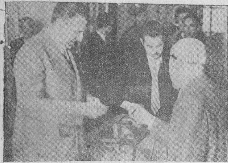
Madrid.—Los miembros del Gobierno español dieron ejemplo en el cumplimiento del deber ciudadano de votar en las elecciones municipales. En la foto, el ministro de Asuntos Exteriores señor Martín Artajo, disponiéndose a emitir su voto.

El porcentaje de votantes alcanza en toda España una cuantía elevadísima