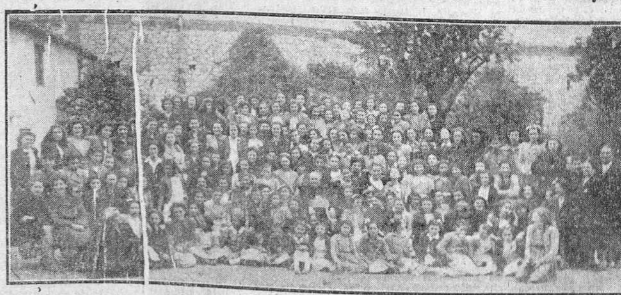
El domingo último la Escuela de Obreras de "Santa María la Mayor" celebró una brillante fiesta de fin de curso con misa de comunión, oficiada por Monsenor Rodero Reca. Después de la ceremonia religiosa fué servido un desayuno a las docenas de obreras reunidas en el jardín del Colegio. A la terminación de tan simpático acto nuestro fotógrafo obtuvo el grupo que reproducimos.