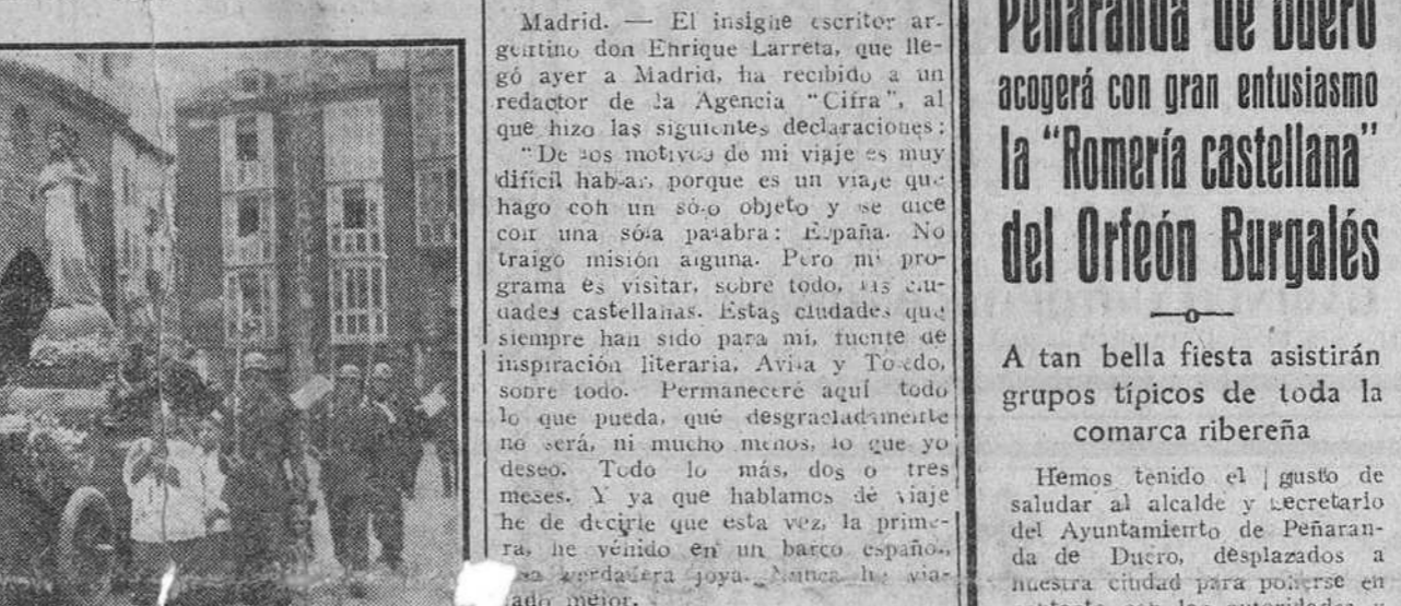
El domingo último recorrió las calles de la ciudad la procesión del Sagrado Corazón de Jesús. La foto muestra el paso del cortejo por la Plaza del Duque de la Victoria.