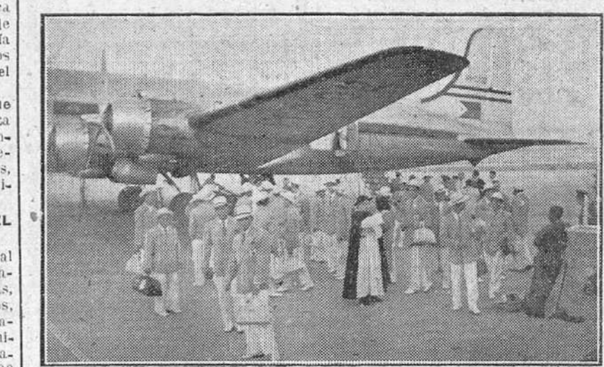
Madrid.—En avión han llegado a Barajas, donde se detuvieron unos momentos en su viaje a Inglaterra, los atletas filipinos que representarán a su país en la próxima Olimpiada de Londres.