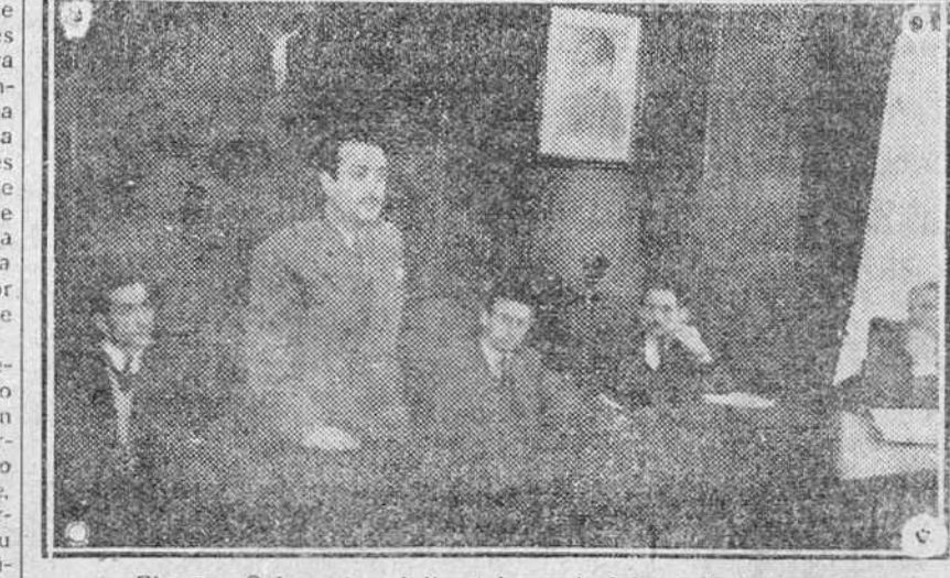
El señor Gobernador civil y jefe provincial del Movimiento dirigiéndose a las representaciones sindicales provinciales en el brillante acto celebrado ayer para exponerles transcendencia y significado de las próximas elecciones.