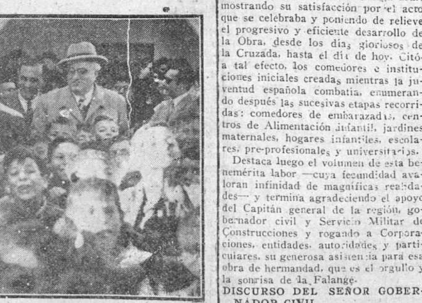
El teniente general Yague, gobernador civil, alcalde de la ciudad y presidente de la Diputación, rodeados por un grupo de niños de la barriada "Juan Yague", después de la bendición e inauguración del centro de alimentación infantil instalado por la Obra de "Auxilio Social" en aquel poblado.