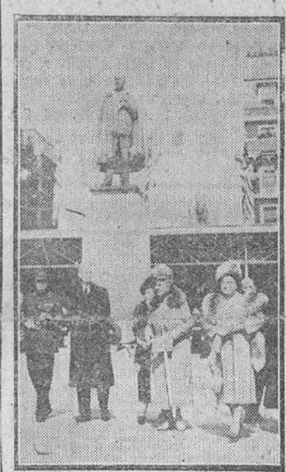
Londres.—Los Reyes de Inglaterra, la viuda de Roosevelt, la Reina Madre Mary, el jefe del Gobierno y el Duque de Gloucester, después de ser descubierta el monumento al Presidente Roosevelt en la plaza de Grosvenor, erigido por suscripción popular. Al acto asistió también Mr. Churchill.