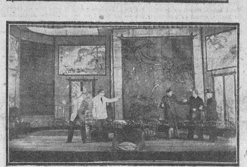
Dos detalles de los actos celebrados ayer en nuestra ciudad, iniciando la conmemoración del XL aniversario de la Ley Fundacional del Instituto Nacional de Previsión: Arriba, el capitán general de la región, entrega al capitán de la selección nacional del I. N. P., la copa que se disputaba en el partido de fútbol. Abajo, un momento de la representación de la farsa cómica "Qué hombre tan simpático", por el Cuadro Artístico del I. N. P. (Fotos FEDE)