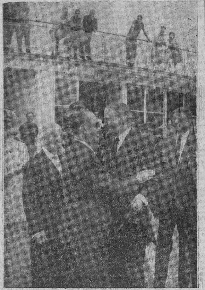
Madrid.—El ministro español de Asuntos Exteriores, don Fernando María Castiella, despidiéndose de varios de sus compañeros de Gobierno en el aeropuerto de Barajas, antes de emprender su viaje a Londres, en visita oficial de varios días de duración.

«Qué posibilidades ofrece España para ustedes en el momento actual? Aunque pueda parecer un poco preterioso por mi parte el dirigirme a personas como (Pasa a cuarta página)