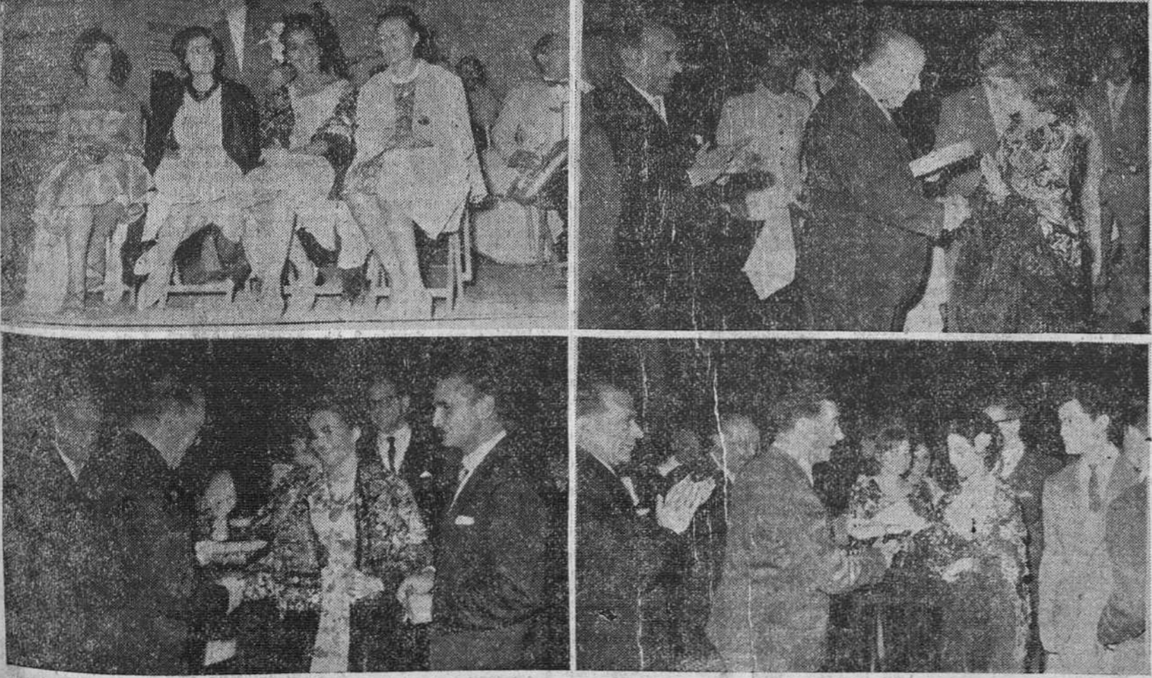
Reportaje gráfico de «Fede» en la Verbena de la Prensa, celebrada el domingo: en primer término, a la izquierda, la Reina de la Prensa, acompañada de su Corte de Honor, durante el Concurso de mantones. En las otras tres placas, el gobernador civil, el alcalde de la ciudad y el presidente de la Diputación haciendo entrega de los premios por ellos otorgados a las triunfadoras de dicho Concurso.