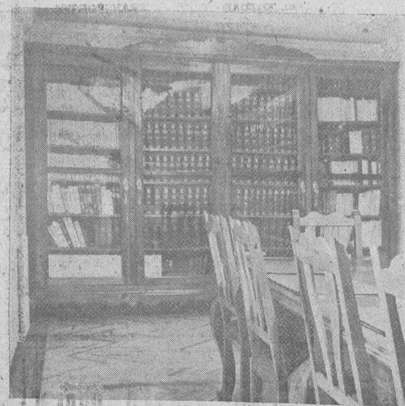
ASPECTO DE LA BIBLIOTECA TECNICA ESPECIALMENTE DEDICADA A OBRAS DE TEMAS ECONOMICO-SOCIALES.