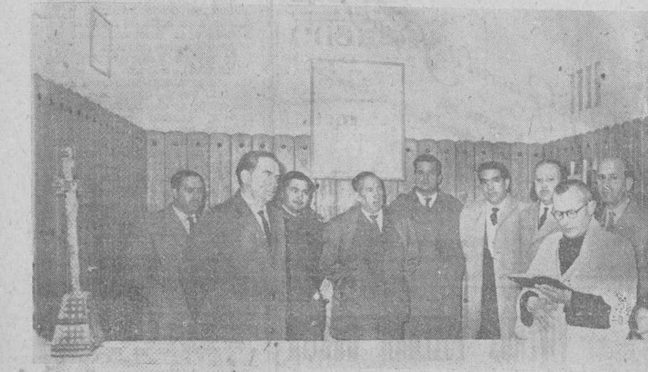
Un momento de la bendición de las instalaciones de la nueva Agencia Urbana que la Caja de Ahorros Municipal ha puesto en servicio en el Mercado de Ganados de San Amaro.

Otros 25 millones para préstamos agrícolas y ganaderos El Excmo. Sr. Gobernador Civil, ha recibido del subsecretario de Agricultura el siguiente telegrama: «Para conocimiento y efectos significativos que en sesión Comisión ejecutiva Crédito Agrícola celebrada hoy se ha acordado poner a disposición Caja Ahorros Municipal la cantidad de 25 millones de pesetas para concesión préstamos agrícolas y ganaderos y asimismo a la Caja Ahorros Circular Católico obreros de esa la cantidad de 12 millones de pesetas para concesión préstamos agricultores y ganaderos. También se concede con la misma fecha autorización alcaldía presidente pósito de Castrojeriz concesión préstamos agricultores con garantía personas hasta límite de doce mil pesetas.»