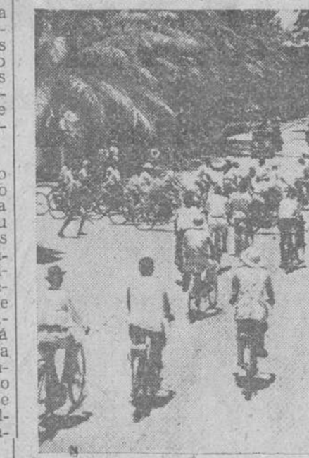
En Brazzaville comienza la invasión y la locura de la bicicleta: calles enteras de gente que pedalea... los ciclistas hacen verdaderas filigranas conduciendo.

Brazzaville — un espectáculo de color y de gusto: las patatas las ponen todas juntas por tamaños hasta las muy pequeñas y las frutas tropicales forman montón en forma de torre — me di cuenta de como la raza — me di cuenta que se pierde. Este hablaba español desde que sus antepasados lo hablaban al ser expulsados de España, y re explicó como un hombre del XVI. —Mire usted; Leopoldville es como Babilonia, todo humo y confusión. Brazzaville, que también tiene su pecado encima, trata de acercarse más a la Jerusalén celestial. Luego me dijo que al negro también se le tiene a raya en Brazza, pero de un modo que quiere ser más inteligente y humano. Comparado con el belga, el ensayo francés es casi una estructura ejemplar, pero también ha estado durante mucho tiempo montado sobre el abuso y la injusticia. Lo que salva a Francia es que se ha preocupado mucho más de proporcionar a los congoleses Centros de Enseñanza Secundaria y Superior en mayor proporción y hasta llevo y sigue llevando mediante becas, a los más dotados a la metrópoli, aun a riesgo de que volvieran trastocados y pensando en revoluciones. En estos momentos, Francia cuenta en el Congo con una "élite" que le responde. LOS DIRIGENTES DE LA REPUBLICA DEL CONGO FRANCÉS Fara presentarme a los dirigentes de la República del Congo, Don Esteban agarró de su estantería el tercer tomo de la Historia de la Literatura de Valbuena