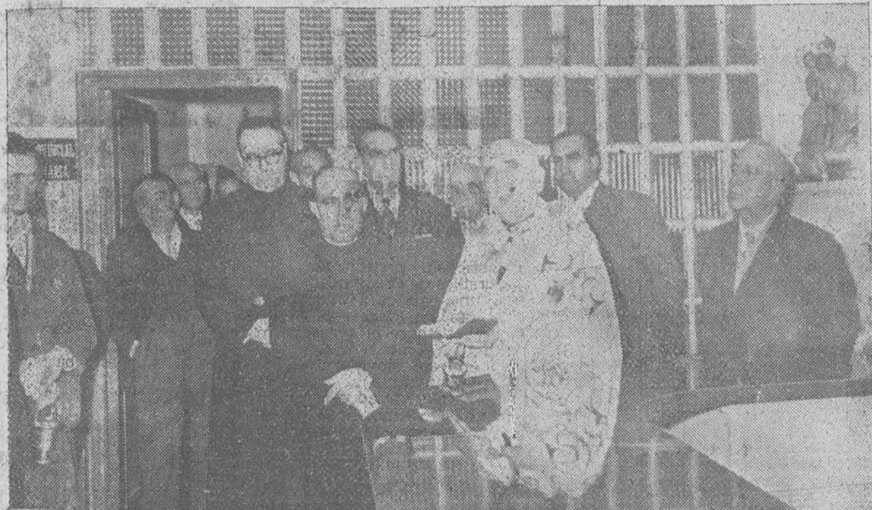
UN MOMENTO DE LA CEREMONIA INAUGURAL.

Entre las instalaciones inauguradas, figura, también, una Biblioteca técnica en materia económico-social