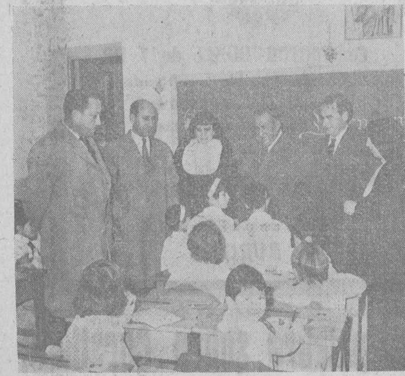
Los miembros del Consejo de Gobierno de la Caja de Ahorros Municipal, director-gerente y otras personalidades, durante la visita efectuada ayer tarde al grupo escolar de párvulos «Pío XII», que en la zona de «Los Niveles», ha creado y sostiene la Institución.

Por la tarde, el Consejo de Gobierno de la Institución visitó el grupo escolar «Pío XII» y las obras ya concluidas de otro bloque de 75 viviendas, en la zona de «Los Niveles»