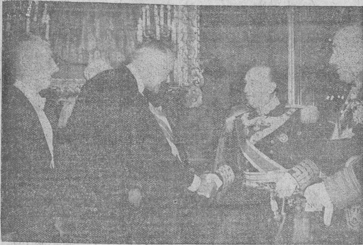
Madrid. — S. E. el Jefe del Estado saluda al embajador de los Estados Unidos, Mr. Lodge, durante la recepción celebrada en el Palacio de Oriente con motivo del XXIV aniversario de la exaltación del Generalísimo Franco a la Jefatura del Estado.