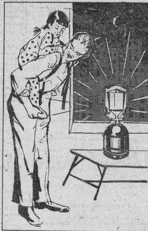
En el hogar, una lámpara auxiliar dispuesta a remediar apagones.