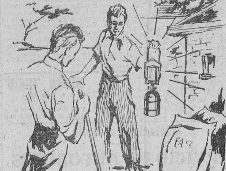
En el campo, el día no termina con el sol.