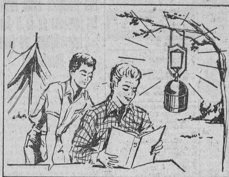
En las excursiones, el complemento que las hará más agradables.

Siempre está asegurado el suministro de gas butano y el recambio en toda España.