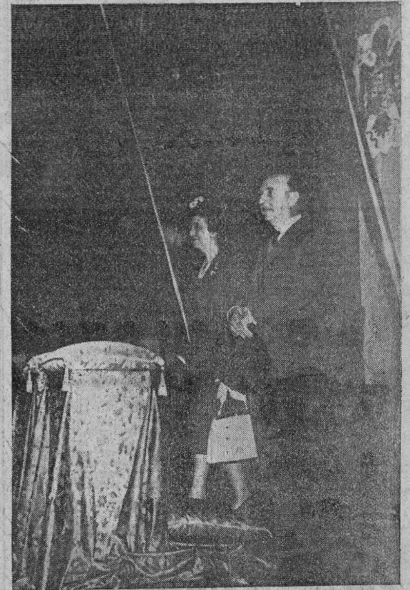
Monasterio de Nuestra Señora de Montserrat.—Su Excelencia el Jefe del Estado y su esposa, en el presbiterio, durante la interpretación de la "Salve de Victoria", durante su visita al Monasterio.

También estuvo S. E. en el Instituto Químico de Sarriá, fundado y regido por la Compañía de Jesús