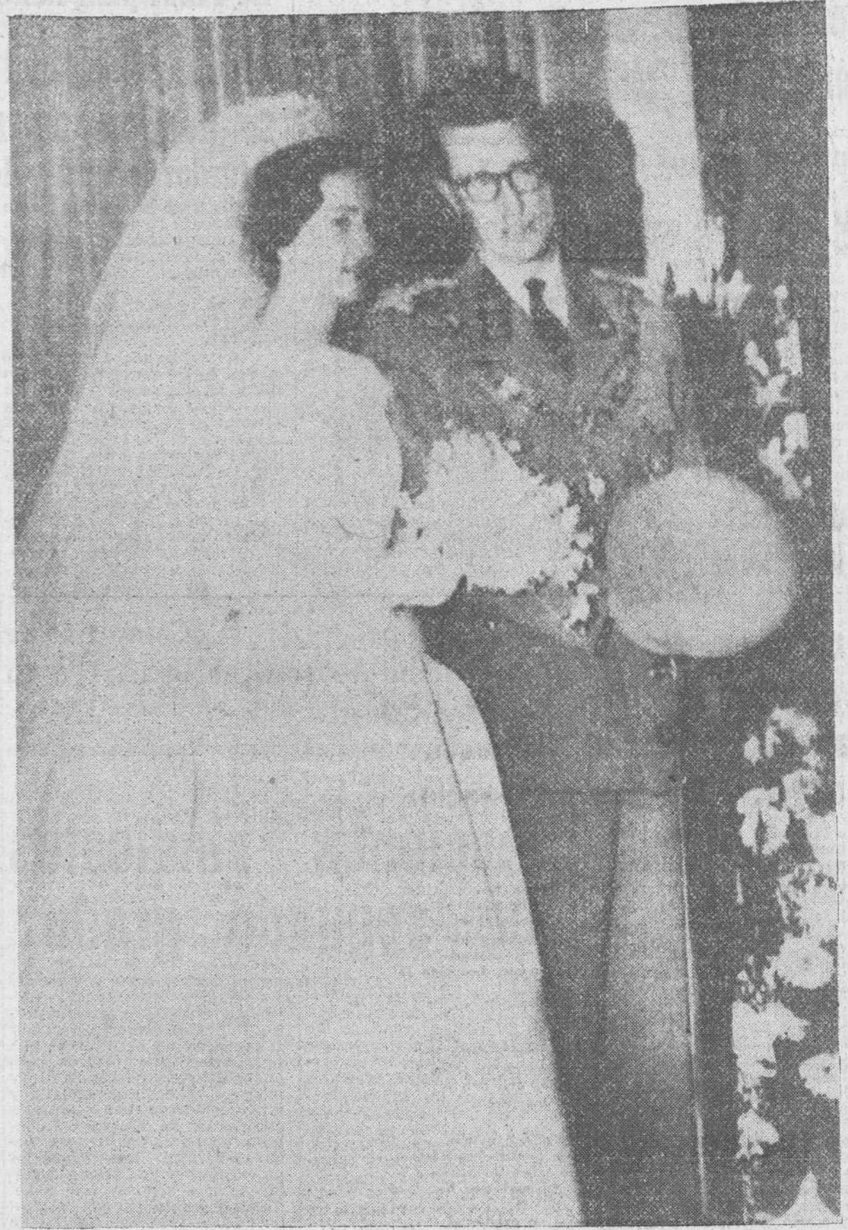
Fotografía oficial de Doña Fabiola de Mora y Aragón y el Rey Balduino de Bélgica, después de su enlace matrimonial, en el Palacio Real.

Bruselas.— Cálculos aproximados hechos por la Policía dan cuenta de que las ceremonias de la boda deben haber sido presenciadas a través de la red Eurovisión, por un total de 150 millones de personas.—Efe.