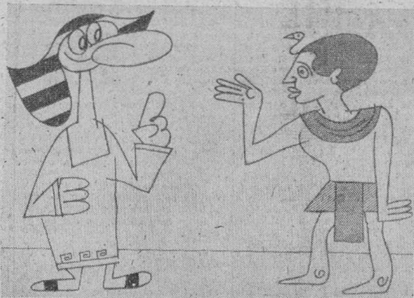
—DIME, OH KALIKATRES SAPIENTISIMO! ¿CUAL ES EL MEJOR DE TODOS LOS CONSEJOS? —Todo, hijo, es MEJOR CON UN LIBRO.

de libros, lo que supone un tercio de libro por cada español. SCLUCIONES