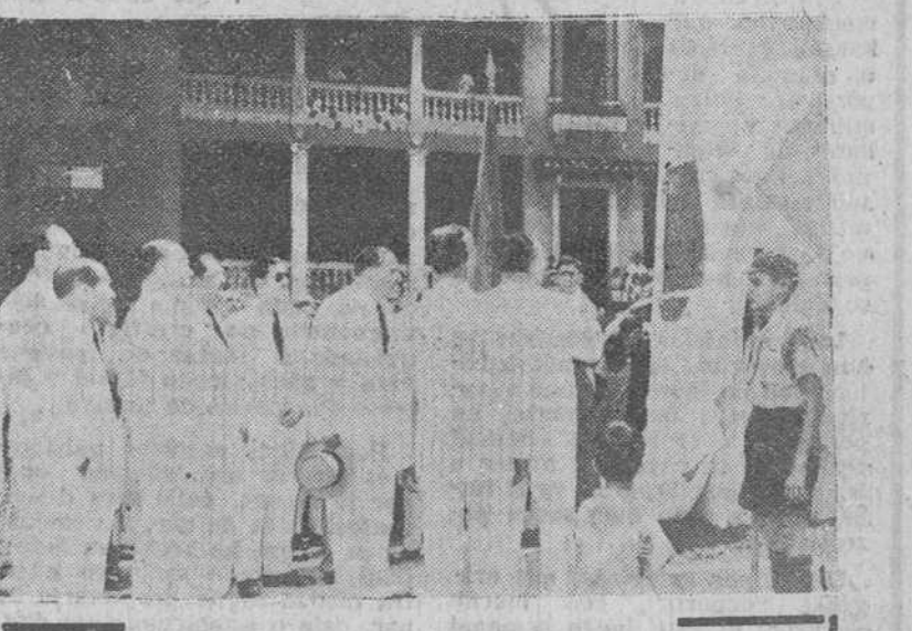
Panamá.— El presidente de la República, coronel Remón, descubriendo el monumento ofrecido por la colonia española a Panamá, con motivo de su cincuentenario. Asistieron al acto, los embajadores de España en Washington y Panamá, don José Félix de Lequerica y Conde de Rabago, respectivamente; los ministros de la Gobernación y Relaciones Exteriores de Panamá y otras personalidades.