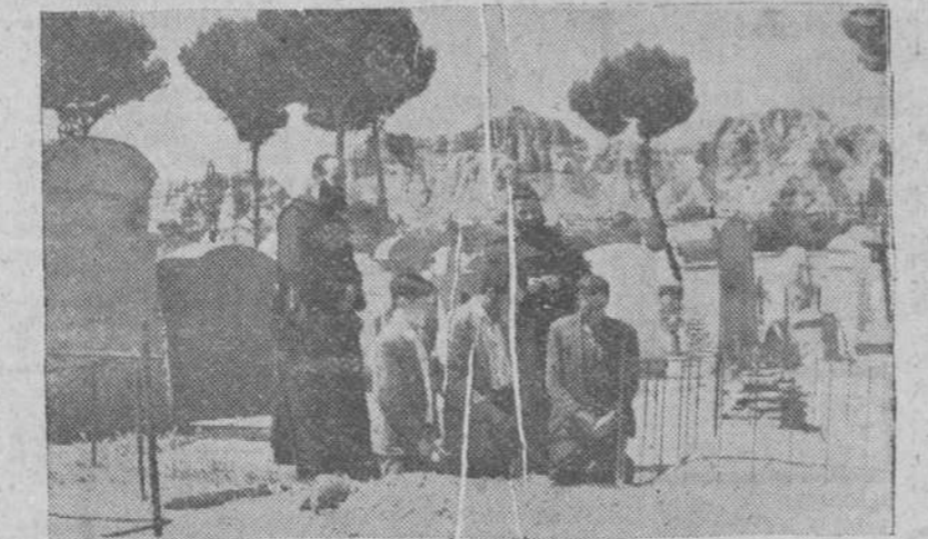
Guadix.— Dos de los seis Hermanos Fossoras de la Misericordia, que atienden a las necesidades del cementerio de esta ciudad, rezando ante la sepultura de uno de los vecinos de la ciudad, que acaban de enterrar, acompañados por los familiares del mismo. Varios Ayuntamientos españoles han solicitado los servicios de esta naciente congregación, para que cuiden de los camposantos de sus respectivas localidades.