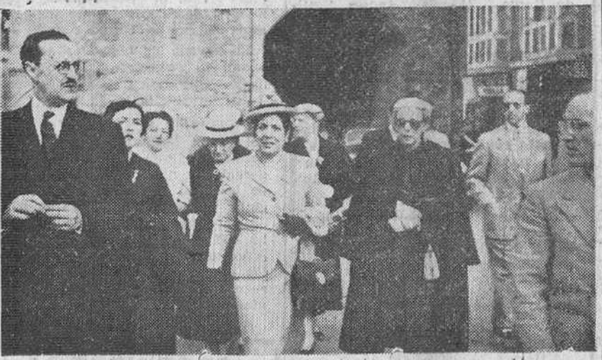
La esposa del presidente del Perú, acompañada de otras distinguidas damas y del alcalde de Burgos y diversas personalidades, dirigiéndose por la plaza del Rey San Fernando a visitar la Santa Iglesia Catedral.

Visitó la Catedral y la Ciudad Deportiva y hoy continuará hacia San Sebastián