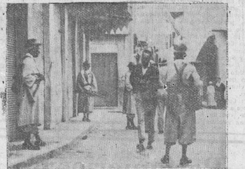
Casablanca. — Para evitar nuevos desórdenes, con motivo de la elección del nuevo Sultán de Marruecos, tropas de las fuerzas indígenas patrullan por las calles y plazas, dispuestas a sofocar inmediatamente cualquier conato de desorden, que puedan provocar los nacionalistas.

Estados Unidos sigue viendo con gran preocupación la situación del Marruecos francés