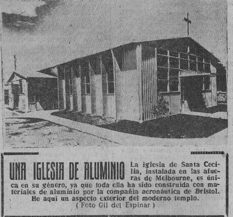
UNA IGLESIA DE ALUMINIO La iglesia de Santa Cecilia, instalada en las afueras de Melbourne, es única en su género, ya que toda ella ha sido construida con materiales de aluminio por la compañía aeronáutica de Bristol. He aquí un aspecto exterior del moderno templo.

París.—En la noche de ayer ha fallecido Marius Renard, el muchacho de 16 años que el día de Navidad le había sido injertado un riñón de su madre.—Efe.