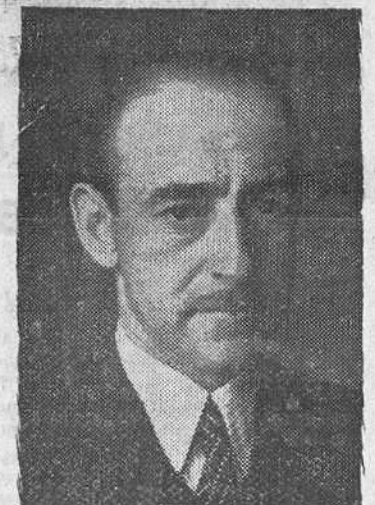
Madrid. -- El ministro de Agricultura, conversó con los periodistas, a primera hora de la tarde y la charla se mantuvo, durante largo rato, acerca de los

Interesantes declaraciones del ministro de Agricultura