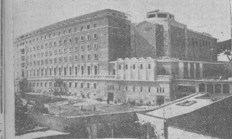
Roma. — Una vista del Colegio norteamericano construido en esta ciudad e inaugurado el miércoles último, por S. S. el Papa.