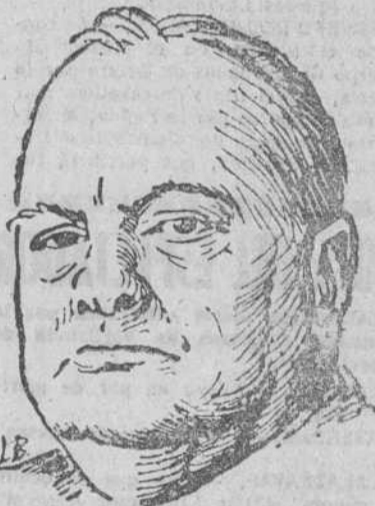
Estocolmo. — Churchill ha sido galardonado con el Premio Nobel de Literatura de 1953.—Efe.