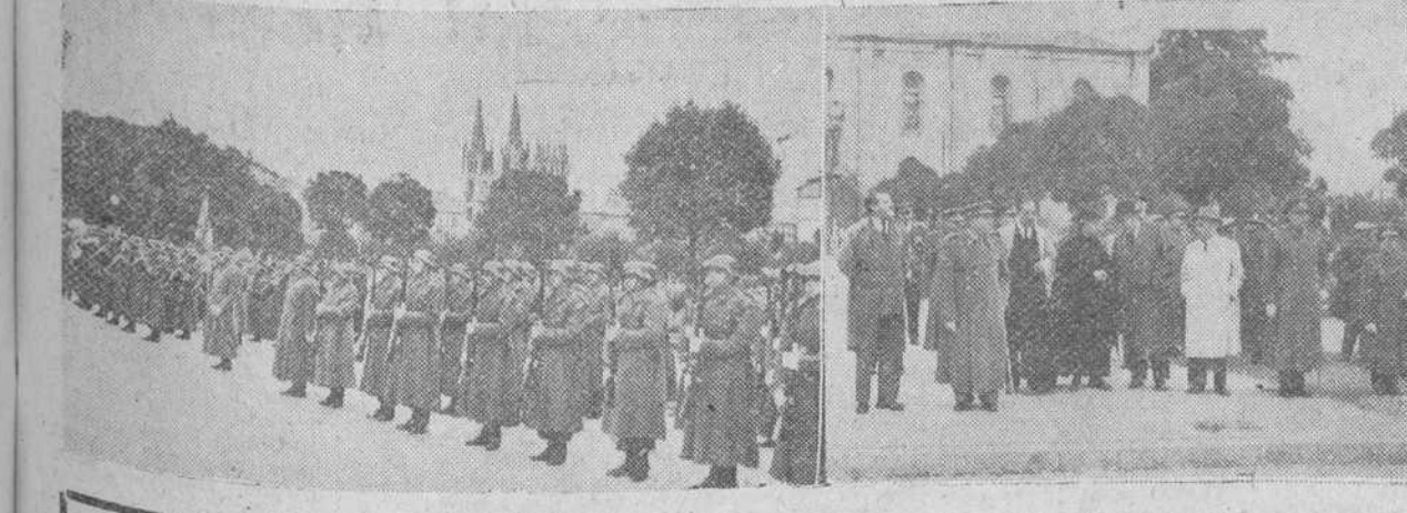
A la izquierda, las tropas de la Sexta Agrupación de Intendencia, que formaron ayer para asistir a la solemne misa celebrada en la iglesia del Carmen, con motivo de la fiesta de su Patrona, Santa Teresa de Jesús. A la derecha, las primeras autoridades burgalesas, presenciando el desfile de las fuerzas.—(Fotos Fede).