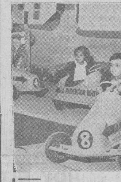
París.—Los niños mayores de ocho años aprenden a respetar el código de la circulación, en la pista de pruebas del Salón del Automóvil, bajo la vigilancia de los agentes.