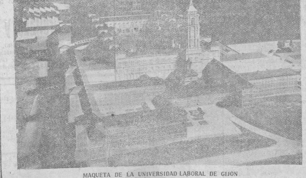
MAQUETA DE LA UNIVERSIDAD LABORAL DE GIJON

En materia de orden público en el mismo periodo de tiempo se han descubierto 51.216 delitos comunes, y en el Instituto Nacional de Moneda Extranjera, la comisaría que allí funciona, intervino en hechos por un total de 21.457.560 pesetas. El gabinete de identificación ha realizado 64.066 identificaciones. Han sido repatriados 4.095 exilados. Esto es someramente un repertaje demostrativo del resurgir de España. No podemos dejar de consignar como remate del mismo la firma del Concordato con la Santa Sede.