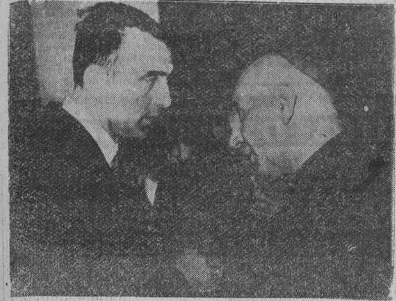
EL MINISTRO DE EDUCACION NACIONAL EN MALAGA. — El obispo, doctor Herrera, cumplimenta al ministro de Educación Nacional, señor Ruiz Jiménez, momentos antes de pronunciar éste el pregón de la Semana Santa malagueña.

(Información y declaraciones del ministro, en tercera página)