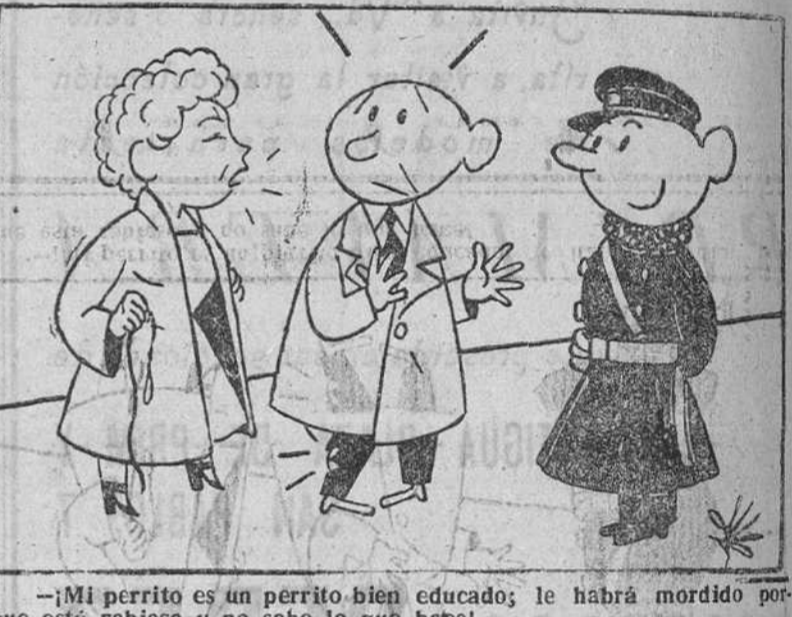
¡Mi perrito es un perrito bien educado; le habrá mordido porque está rabioso y no sabe lo que hace!