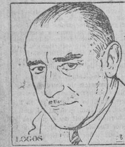
D. RAFAEL CAVESTANY ministro de Agricultura