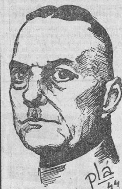
Hannover.—En su casa de esta ciudad ha fallecido el mariscal alemán Von Rundstedt, que contaba 78 años de edad.—Efe.