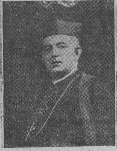
FALLECIO A LAS DOS DE LA TARDE