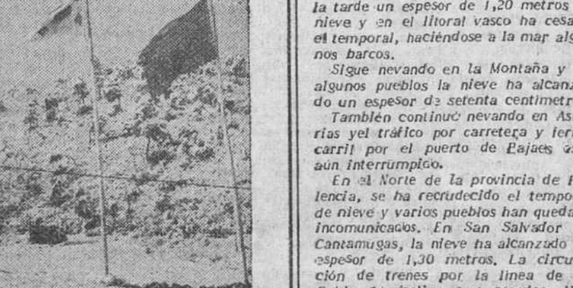
En un puesto de mando de las Naciones Unidas en el frente de Corea, ondean al viento, de izquierda a derecha, las banderas de los Estados Unidos, O.N.U., Corea y Colombia

Barcelona. — En la sala de máquinas de "La Vanguardia" se ha celebrado el acto de imponer