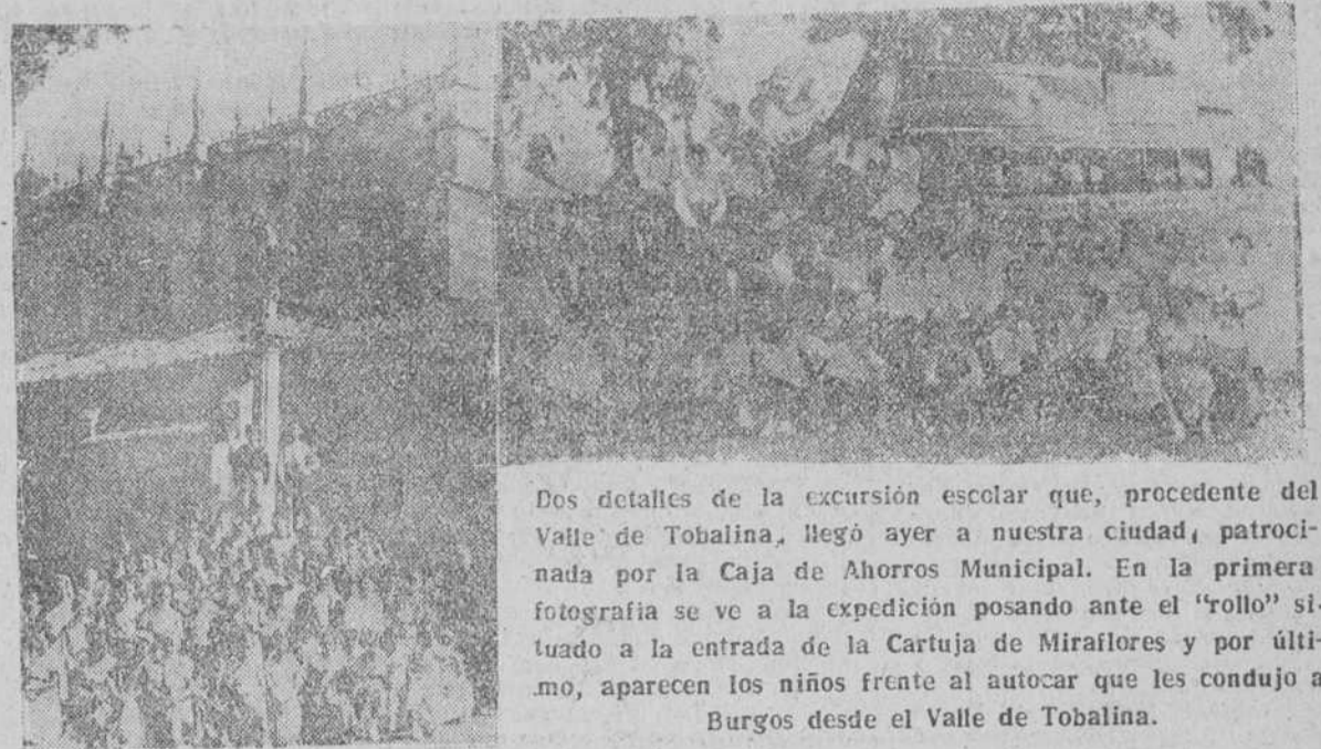
Dos detalles de la excursión escolar que, procedente del Valle de Tobalina, llegó ayer a nuestra ciudad, patrocinada por la Caja de Ahorros Municipal. En la primera fotografía se ve a la expedición posando ante el "rollo" situado a la entrada de la Cartuja de Miraflores y por último, aparecen los niños frente al autocar que les condujo a Burgos desde el Valle de Tobalina.

El acuerdo de su Consejo, dentro de su función benéfica, es dar a conocer anualmente la Cabeza de Castilla a niños pertenecientes a cuatro comarcas provinciales