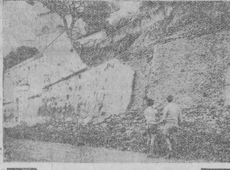
Roma. — Detalle de los destrozos causados por la furiosa tormenta que el jueves azotó a la capital italiana, en los muros que circundan los jardines del Vaticano.