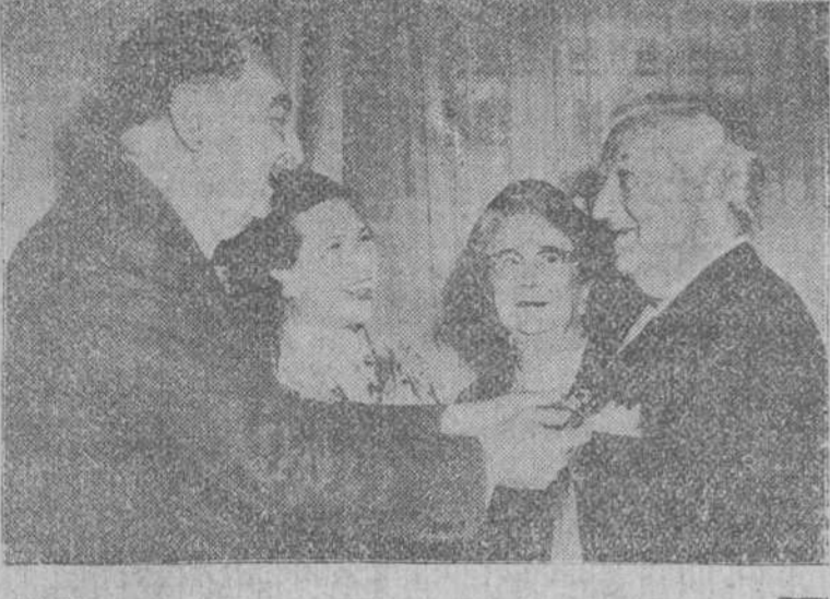
Washington. — Don José Félix de Lequerica, embajador español en los Estados Unidos, imponiendo al senador Pat Mc Carran, la Gran Cruz de la Orden de Isabel la Católica, que le fué concedida recientemente por el Gobierno español. En la fotografía aparecen también de derecha a izquierda la señora de Lequerica y Mrs. Mc Carran.