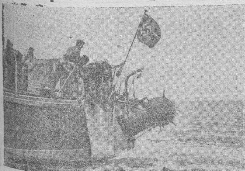
En un lanzaminas alemán se realiza con toda sencillez la operación de cerrar con minas los pasos a los buques enemigos