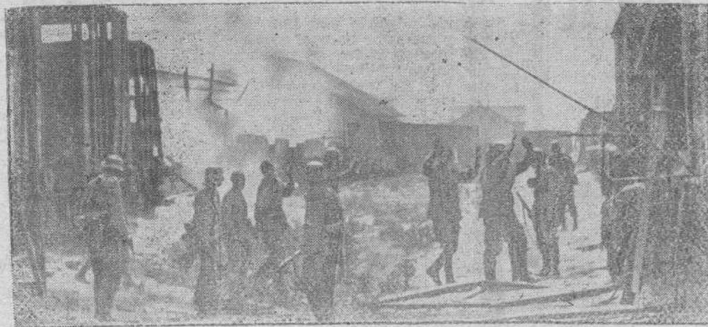
Los pequeños grupos que en Stalingrado intentaron defender la gran fábrica "Octubre Rojo" se entregan a los soldados alemanes