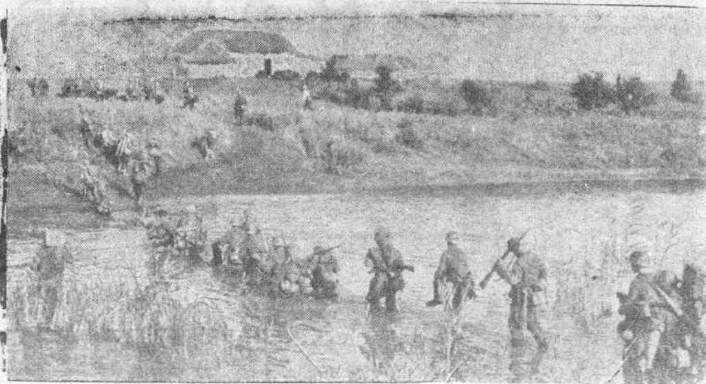
La infantería alemana en el Este, vadeando un riachuelo del Cáucaso.