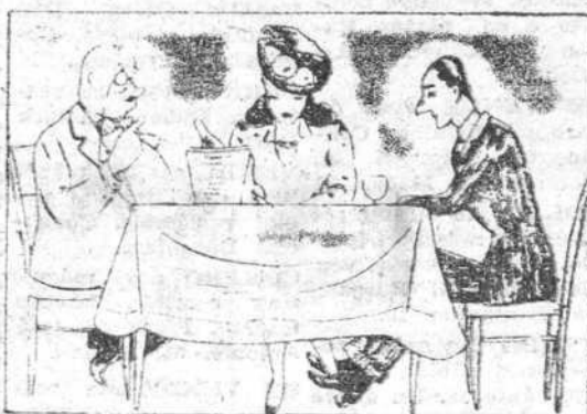
«¿Cree Vd. en la posibilidad de un Segundo Frente?»