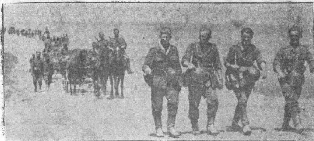
En la victoriosa acción en el Este, estas tres palabras son la única verdad que reflejan los prodigios realizados por los soldados alemanes y sus aliados. En cientos y hasta miles de kilómetros, se miden las prodigiosas marchas de los infantes alemanes, siempre sonrientes y decididos, por la verdad de su éxito.