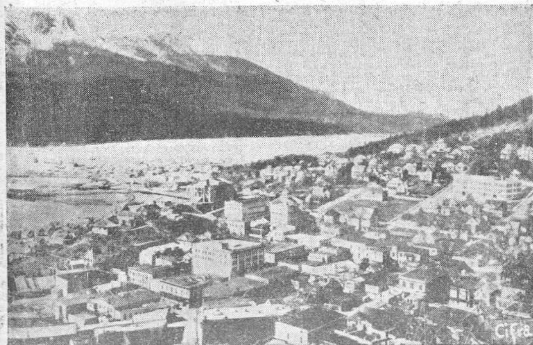
Vista de la ciudad y puerto de Juneau, capital de Alaska.