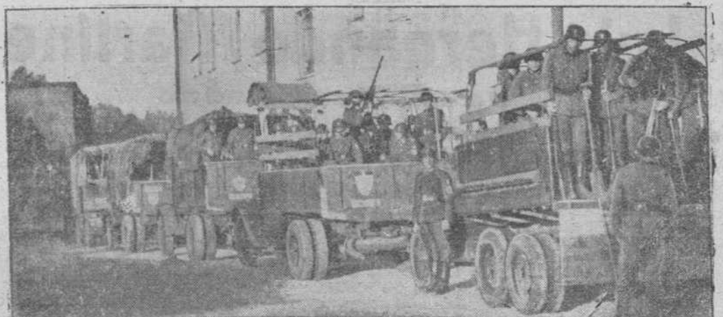
Columna motorizada del Servicio del Trabajo alemán en una ciudad rusa de las muchas que reciben su labor constructora