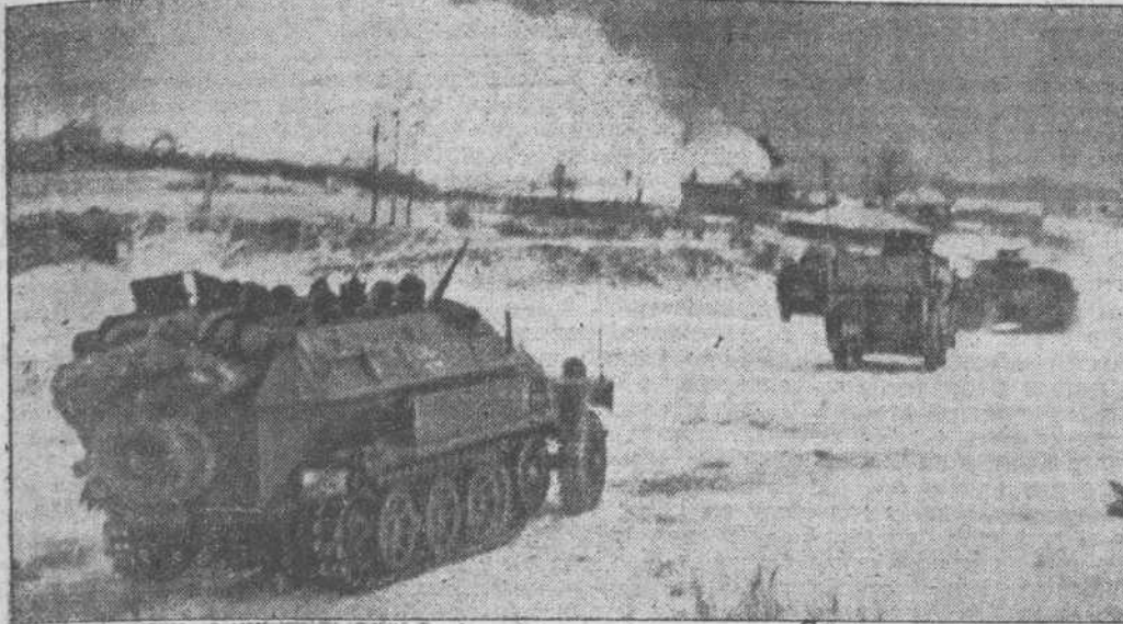
Las tropas bolcheviques han incendiado la ciudad roja que no pudieron defender a pesar de "su ofensiva de invierno"; los primeros destacamentos blindados alemanes entran en la población, que no es más que un montón de ruinas cubiertas por la nieve. Con este brio, a pesar del invierno, así se mantiene la eficacia alemana en el frente del Este