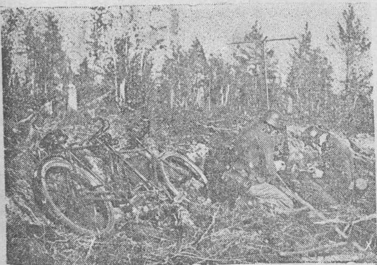
Desmontados del tandem, estos soldados alemanes transmiten su mensaje al puesto de mando