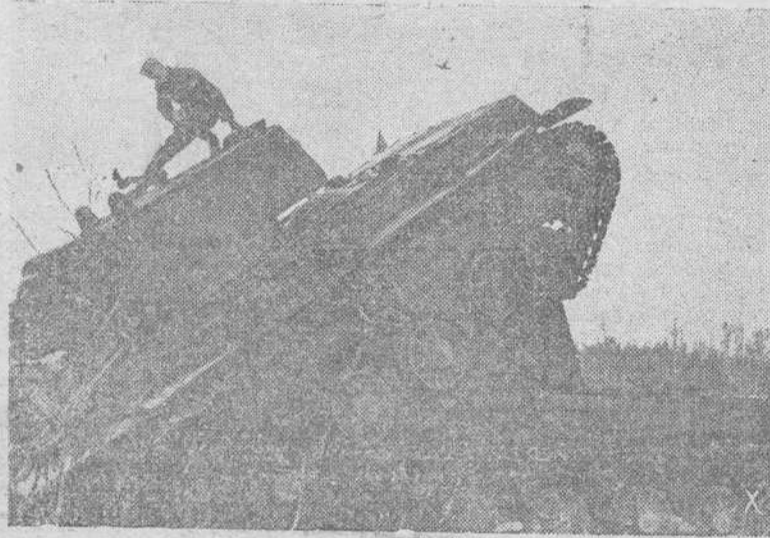
Un tanque pesado soviético alcanzado por la defensa alemana, quedó en esta posesión al chocar con otro carro ruso