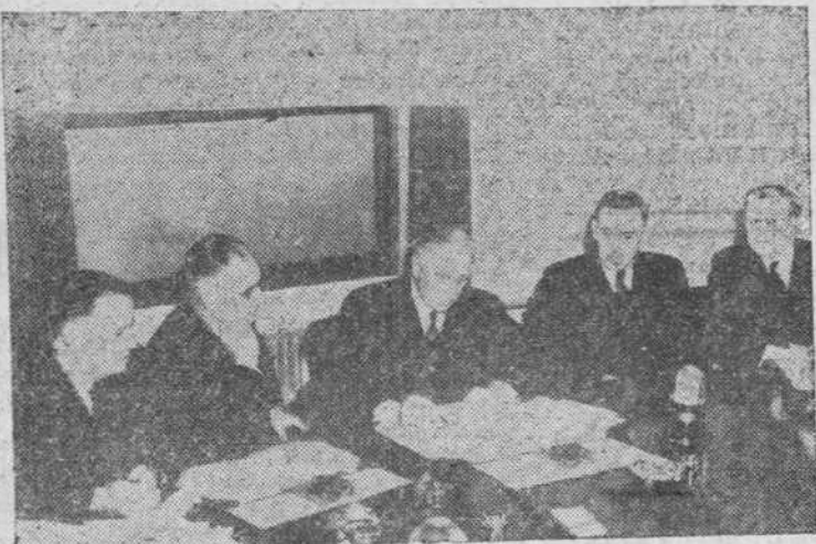
El Gobernador general de Australia, Lord Gowrie, con el primer ministro, Curtin, y miembros del Gobierno, en el acto de la firma de la declaración de guerra al Japón

Reciba desde estas columnas sincero aplauso y enhorabuena su autor, el Abad mitrado de Silos, académico numerario de la Historia y vocal del Consejo Superior de Investigaciones Científicas.