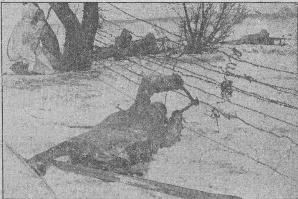
Mientras uno corta las alambradas puestas por el enemigo, otros están con las armas preparadas para rechazar cualquier ataque que sería descubierto enseguida por el que no deja de observar la zona de nadie con los gemelos de campaña.