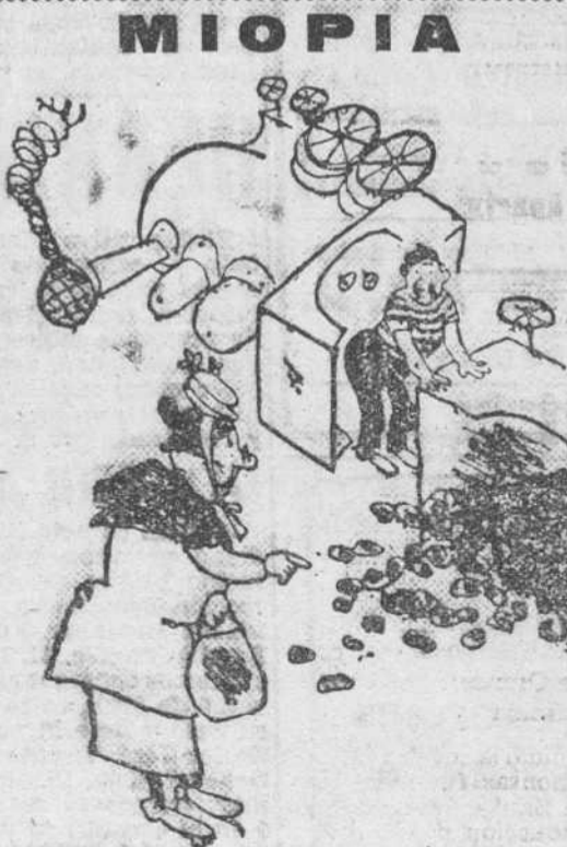
--Perdone usted, ¿a qué hora se distribuye el carbón?

No dejes de cotizar las cuotas del Subsidio Familiar.