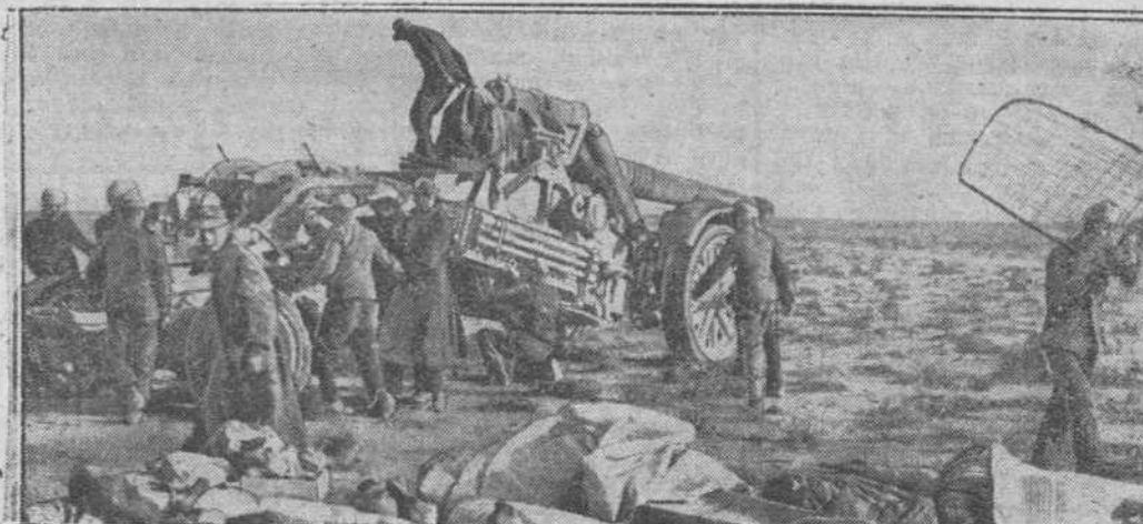
Cambio de posiciones en un punto avanzado del escenario de guerra del Norte de Africa. Ante el avance, la pieza alemana de artillería será llevada a posiciones más avanzadas