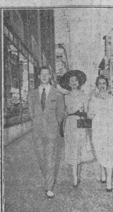
Nueva York. — Los marqueses de Villaverde acompañados de sus principales acompañantes recorren la ciudad.