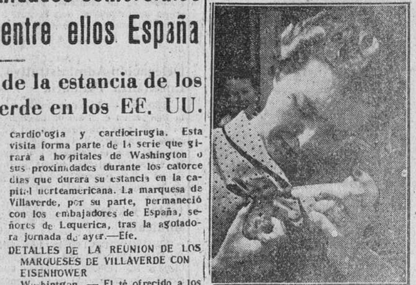
Este simpático conejillo silvestre, fue hallado en el campo por la famosa cantante francesa Line Renaud, quien lo ha adoptado y trata de salvarlo, alimentándolo con un pequeño biberón.