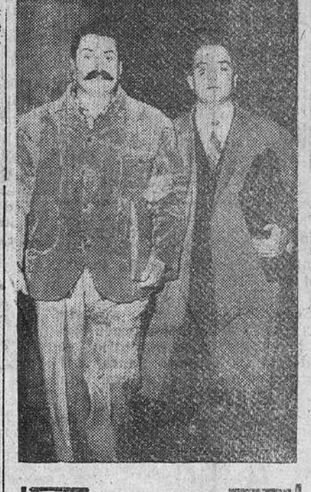
Milán. — Se ha celebrado el juicio con motivo de la querrela presentada por el ex-primero ministro italiano De Gasperi, contra Giovanni Guareschi, autor del famoso libro "Don Camillo", acusado por difamación. El tribunal ha condenado a Guareschi a un año de prisión, pero el gran jurista y escritor seguirá en libertad, en tanto el Tribunal Supremo resuelva el recurso de apelación presentado por aquél. En las fotos aparecen De Gasperi, apenándose de su automóvil para asistir al juicio y Guareschi dando el brazo a su defensor, al dirigirse a la sala de justicia.