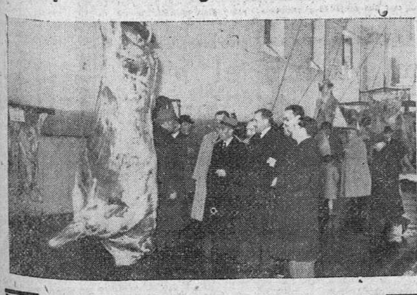
En el Matadero Municipal se celebró a mediodía de ayer la tradicional exposición de ganado sacrificado. En la foto aparecen las autoridades que presidieron el acto, admirando uno de los cebones premiados.