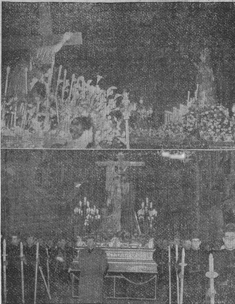
De izquierda a derecha: en la parte superior, el monumento al Santísimo, instalado en las escalinatas de la puerta de Coronera, de nuestro Santo Templo Metropolitano y que fue visitado el Jueves Santo por millares de burgaleses y la carroza del Santo Entierro, en la solemne procesión celebrada ayer noche. En la parte inferior, el momento del simbólico encuentro de la Virgen María con su Divino Hijo, en la evocadora procesión celebrada el jueves por la tarde y una vista del nuevo "paso" del "Descendimiento", que ayer desfiló por primera vez en la procesión del Santo Entierro.

Lima. — Los oficios del Viernes Santo se han celebrado hoy en la Catedral limeña, con la asistencia del presidente Ordía y destacadas personalidades. Asimismo en todos los templos de la capital numerosísimos fieles han acudido a escuchar el sermón de las Siete Palabras.—Efe.