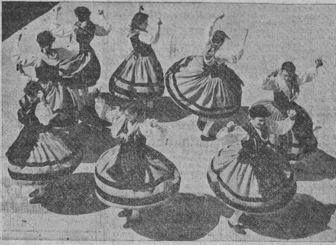
He aquí el grupo de danzas de la Sección Femenina que el verano del año último intervino en los festivales de danzas celebrados en el palacio de la Magdalena. El fotógrafo captó el momento en que las muchachas de Burgos trenzan una bella danza, "La Jerigonza", de Salas de los Infantes.

Mañana emprenden su viaje las diez muchachas burgalesas que son depositarias de un cordial mensaje del alcalde para el Ayuntamiento irlandés