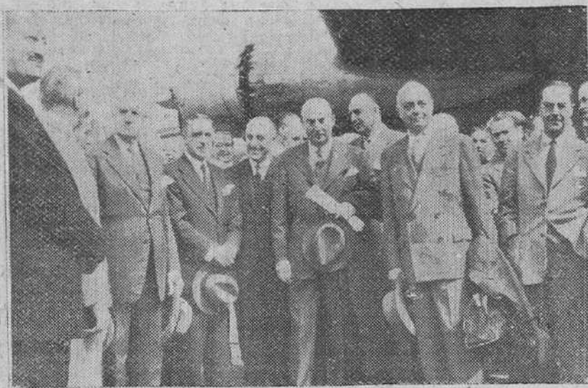
El ministro de Comercio y los subsecretarios de Comercio e Industria, fotografiados con los ministros de Hacienda, Obras Públicas, Marina, Agricultura e Industria, el embajador de los Estados Unidos en España y otras personalidades, momentos antes de emprender el viaje, los tres primeros, a los Estados Unidos.