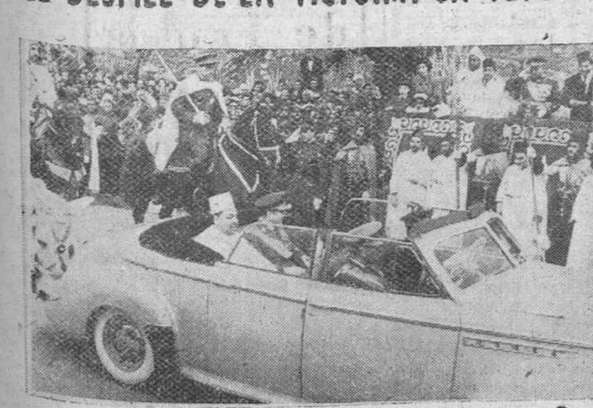
Tetuan.— Su Alteza Imperial el Jefe con el alto comisario de España en Marruecos, a su llegada a la tribuna presidencial, para presidir el desfile conmemorativo del XV aniversario de la Victoria.— (Foto Cifra)