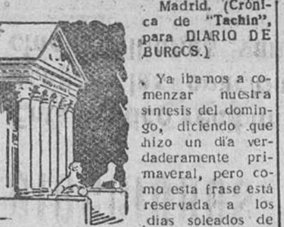
Madrid