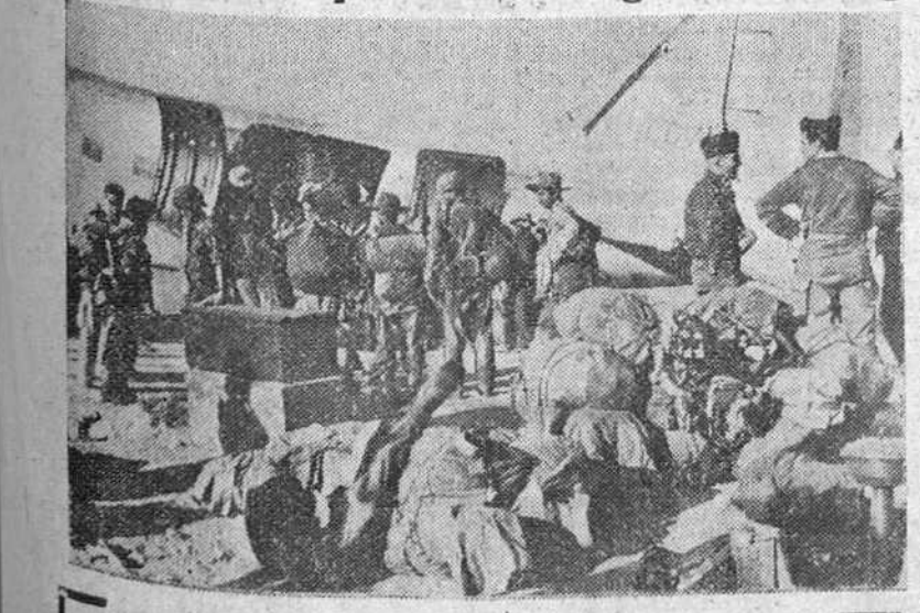
El puente aéreo de Luang Prabang registra estos días una extraordinaria animación. Sobre la cercada capital de Laos fluyen constantemente refuerzos de todas las clases. En la foto vemos un avión del puente aéreo, embarcando a hombres y material, con destino a dicha capital.