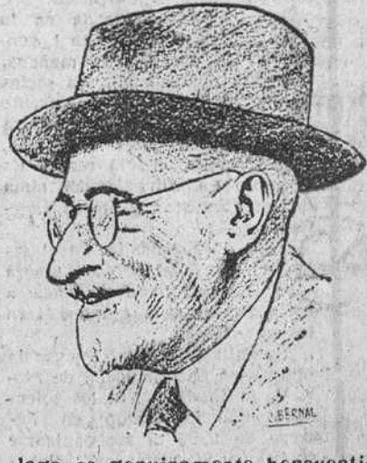
logo es genuinamente benaventino, de trases ingeniosas, de algunas sentencias de fácil filosofía, de gracia, donaire y vivacidad.

Un aristócrata arruinado remedía su situación casándose con una zapatera rica (ambos eran viudos) y en cambio se opone a que su hijo se case con la hija de su nueva esposa, por prejuicios de clase, estableciendo así el autor el contraste entre el matrimonio maduro, por interés, y el de los jóvenes, por amor, aunque no toma partido por ninguno, ya que don Jacinto permite, con imparcialidad, que cada cual exponga sus razones. El desarrollo de este tema es sereno, carece de tensión dramática y hasta los personajes, apenas bosquejados, resultan de escaso relieve. Toda la comedia es una conversación, una larga conversación que se escucha con agrado e interés, porque el diálogo es genuinamente benaventino, de trases ingeniosas, de algunas sentencias de fácil filosofía, de gracia, donaire y vivacidad. Esto es todo y no es poco. Todo el mérito está en el diálogo. La nueva comedia quedará entre las mejores de la serie de obras ligeras, de agradable esparcimiento, de diversión retonza y traviesa con que Benavente, a sus ochenta y ocho años, juega a hacer un tipo de teatro que hasta la fecha no ha podido ser desplazado o ensombrecido por las nuevas promociones de autores.