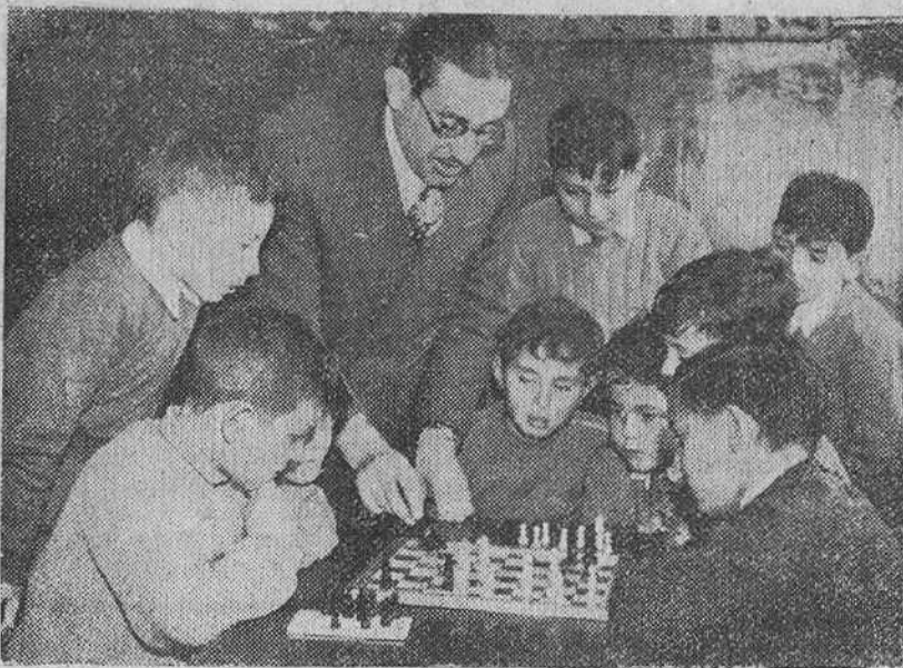
Madrid. — En virtud de una reciente disposición del Ministerio de Educación Nacional, el ajedrez se ha hecho obligatorio en los centros de enseñanza. En las escuelas se enseña a los niños a practicar este deporte cerebral, beneficioso para el desarrollo de todas las inteligencias.