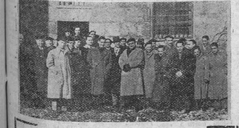
Los miembros de la burgalesina Sociedad "Unión Artesana", acompañados de los representantes de otras entidades hermanas, fotografiados junto a la iglesia de San Lemes, después de asistir a la misa celebrada con motivo de su fiesta patronal.