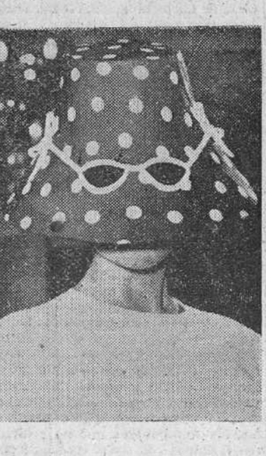
Paris. -- Original sombrero, creado por Jacques Fath y presentado recientemente, en una exhibición de modelos de Primavera. Es de color rosa, con lunares blancos y lleva unas gafas ahumadas, para proteger al rostro de las quemaduras del Sol. De femenino y bello no tiene nada, pero será muy útil a las mujeres de rostro poco agraciado.