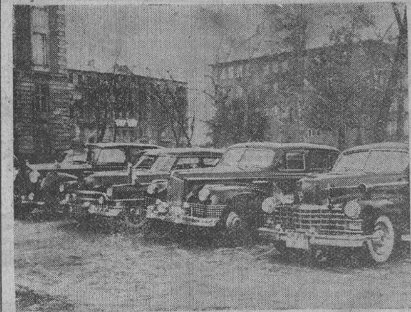
Berlín.— Los automóviles de los "cuatro grandes", aparcados junto al edificio de las autoridades aliadas de control, mientras se celebra la primera sesión de los cuatro. Como puede apreciarse, el "haiga" del ministro soviético Molotov (tercer de izquierda a derecha), no difiere en nada, entre los "Ladillacs" de los ministros franceses y norteamericanos.