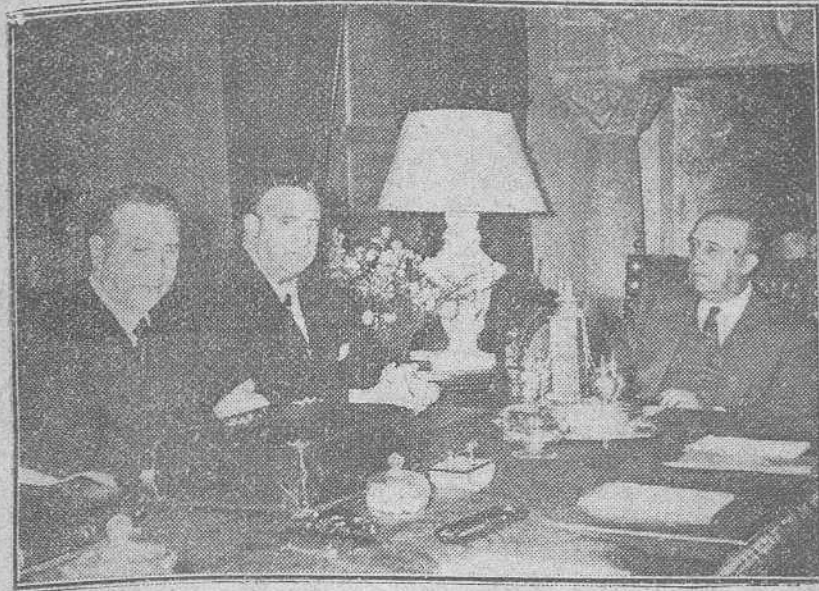
La Coruña. — Un momento del Consejo de Ministros celebrado ayer en el Pazo de Meiras, presidido por S. E. el Jefe del Estado.