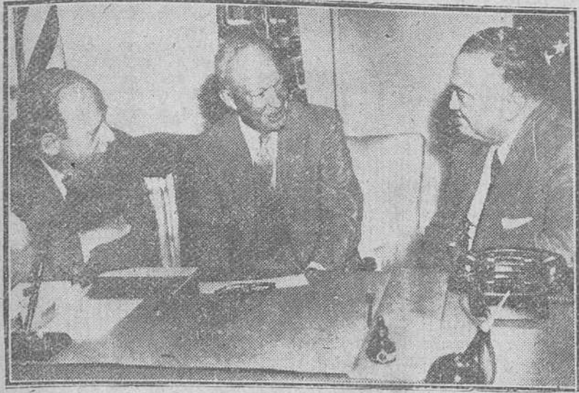
Denver. — El presidente Eisenhower, con el secretario de Justicia y fiscal general de los Estados Unidos, Mr. Herbert Brownell (izquierda) y el director del F. B. I. Hoover, en la reunión celebrada en la residencia veraniega del presidente para tratar de los planes a usar contra el partido comunista norteamericano.