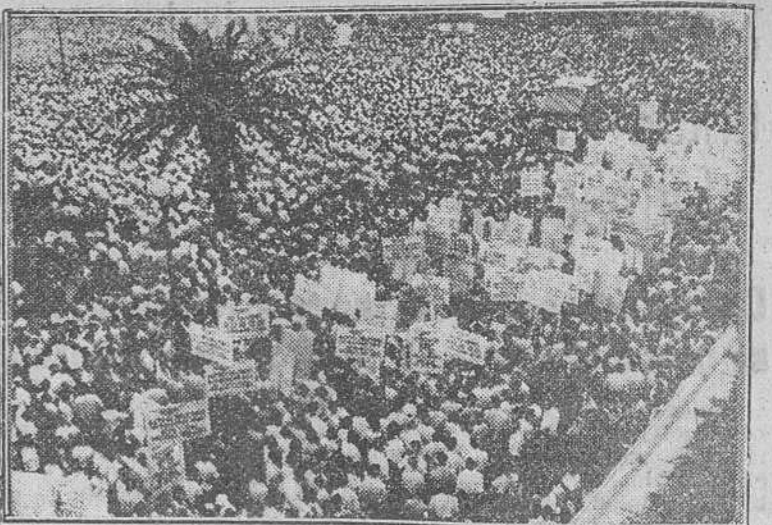
Atenas. — Dosiscientas mil personas han respondido al llamamiento hecho por el arzobispo primado de Grecia, Mons. Spuirdon, y se han concentrado en la plaza de la Constitución de Atenas pidiendo la anexión de Chipre a Grecia.