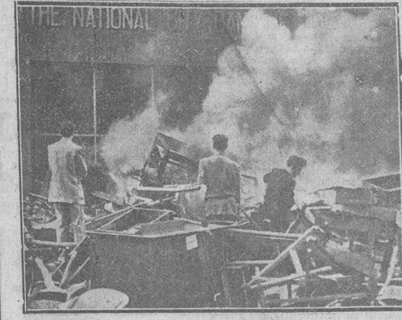
En Porto Alegre, capital del Estado natal del presidente Vargas, la muchedumbre ha asaltado este Banco norteamericano.