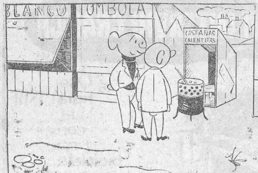
—Es un poco insólito, pero quizá tenga éxito.

Ya cuenta con aparato de radio el niño enfermo para quien fué solicitado en el programa "Cita para amar a los pobres"